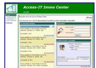
Version WEB d'Immo Center